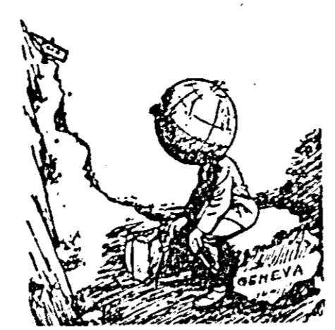
Drumul e greu... totuși bătrînu glob îl străbate.