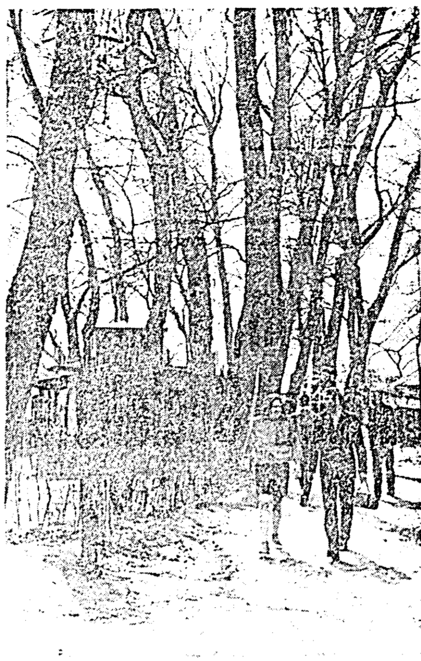
Pimbarie in decorul primăverii la Insula Mureșului.

diilor, compartimentul de organizare științifică are nevoie de un sprijin mai substanțial atât din partea comitetelor de direcție cât și din partea comitetelor de partid. Orice studiu ajuns în această fază trebuie discutat în comitetul de direcție și în caz de aprobare, planul de măsuri care însoțește studiul trebuie să devină sarcină de serviciu pentru compartimentele respective din uzină. Urmărirea realizării măsurilor revine compartimentului de organizare științifică din întreprindere, acesta urmind să informeze periodic conducerea asupra felului cum se realizează obiectivele stabilite. Se constată că eficiența activității de organizare științifică în întreprindere este direct proporțională cu seriozitatea cu care conducerea tratează această activitate. Dacă directorul întreprinderii urmărește obiectivele care trebuie atinse prin studiile de organizare științifică, controlează îndeaproape activitatea de elaborare a acestor lucrări și aplicarea măsurilor rezultate din studii, atunci compartimentul de organizare științifică poate să devină un auxiliar prețios în munca de conducere, un instrument cu ajutorul căruia să rezolve problemele majore și de perspectivă ale întreprinderii. Există asigurate toate condițiile ca activitatea colectivelor de organizare științifică din întreprinderi să se desfășoare la nivelul cerințelor dar ea trebuie tratată cu toată atenția cuvenită de conducerea întreprinderii.