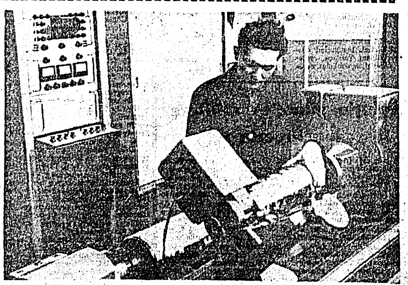
La Uzinele textile „30 Decembrie” se execută zilnic sute de metri de țesături. Opera-