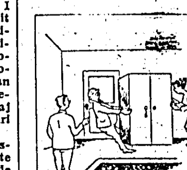
LOCATARUL: Uite așa închidem noi ușa în fiecare seară. Cu dulapul...

În cîteva apartamente din blocul de pe strada Mircea Stănescu, nici după un an de la darea în folosință nu s-au pus cianje la uș.