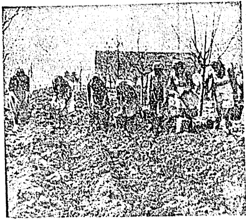
Pe lângă alte lucrări din actuala campanie agricolă de primăvară, colectiviztii din Șofronea plantează cartofi pe o suprafață întinsă.

ÎN CLISEU: un grup de colectivizte lucrînd la plantatul cartofilor.