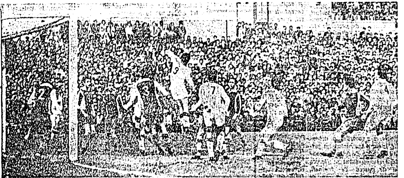
O FAZĂ DIN MECIUL UTA — PETROLUL

Progresul—Petrolul; Știin-ța Timiș—Știința Cluj; Me-talul—Rapid; Dinamo Bucu-rești—Steagul roșu; Jiul—Mi-nerul; Dinamo Pitești—Steaua; Dinamo Bacău—U.T.A.