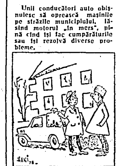
— Motorul merge „în gol”, iar benzina se consumă din plin... — N-o plătesc din buzuna-rii meu; mașina e a întreprin-derii...