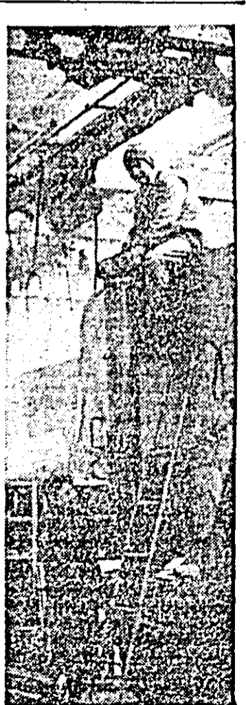
Aspect de muncă la întreprinderea mecanică pentru agricultură.