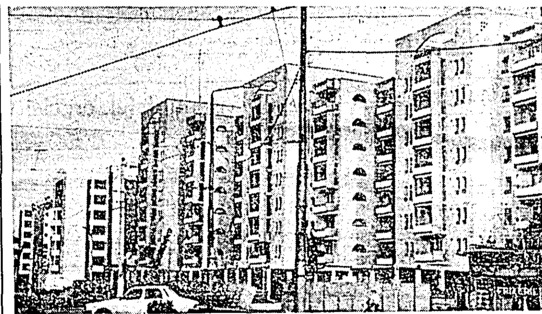
În zona cartierului Aurel Vlaicu, constructorii de la I.A.C.M. Arad finalizează alte blocuri de locuințe.

Asă la ora 21: Vreți în general închisă va fi noros. Vor fi care vor avea șanse de aversă. Vint moderat din sectorul N. Temperaturile vor fi între 9 și 14°C, iar cele maxime între 19 și 24 grade. (Tuliu Brak, meteorolog)