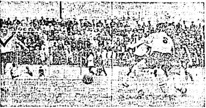
Fază din timpul jocului dintre CFR Arad și Gazmetan Mediaș