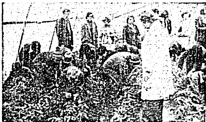
Secvență din timpul activităților practice efectuate pe locul școlar de elevii Școlii generale din Păușy.