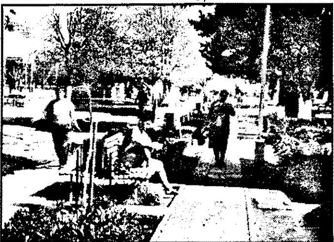
Pe strand se lucrează din plin. Deși amatorii de plajă au început să-și facă apariția cu o săptămână înaintea deschiderii oficiale de pe data de 1 mai a.c.