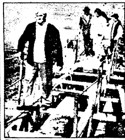
Podul de bărci este un real pericol. Lipsa scândurilor obligă pe cei care trec podul să facă exerciții de echilibristică...