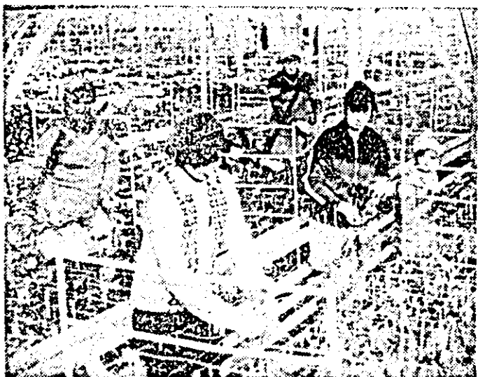
Se culeg crizantemele la serele C.A.P. Iratoșu.