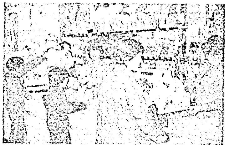
Războiul de jucării al magazinului „Căminul”, reprezintă un loc al bunel deserviri.