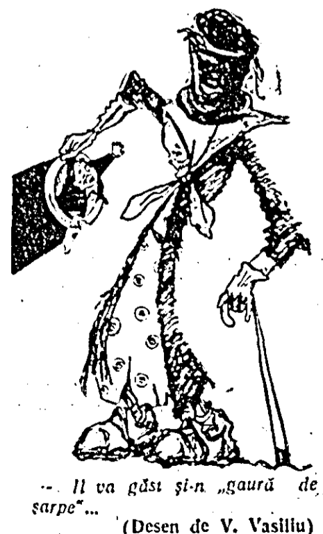
„El va găsi și-n „gaură de șarpe”... (Desen de V. Vasiliu)