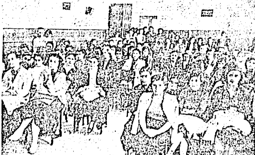
Un aspect de la alegerea comitetului de luptă pentru pace de la Grupul școlar sanitar din oraș.