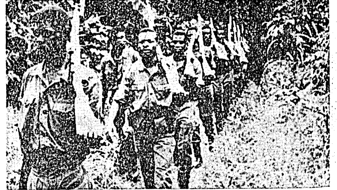
În ultima vreme s-au intensificat luptele detașamentelor de parșutizanti din Angola. Ele luptă mai ales în regiunea Cabinda și în nordul Angolei. ÎN FOTOGRAFIE: un detașament de parșutizanti angolezi din regiunea Cabinda.

BEIRUT 29 (Agerpres). — Cu 55 de voturi, contra 20, Parlamentul libanez a acordat joi seara voțul de încredere guvernului condus de Abdullah Yafi. Agenția Reuter menționează că din cei 99 de membri ai Camerei Reprezentanților din Liban, 13 deputați s-au abținut, respectiv grupurile sprîlînă pe fostul premier Rashid Karame, iar 11 deputați au fost absenți. Printre cei ce s-au abținut figurează și deputatul fostului președinte Camille Chamoun.