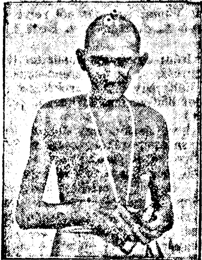
DR. MAHATMA GHANDI

Lahoreból jelentik: A nagy hindu kongresszusok, amely már napok óta tart és amelyről több ízben megemlékeztünk, ma van a