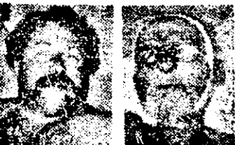
— Foto nr. 1 și 2

În noaptea de 25/26 septembrie, în bazinele din fața barului de la Parcul mic, a fost găsit un bărbat de circa 30-35 ani, înălțimea 1,80 m, solid, păr castaniu, chelie frontală pronunțată, în stare de comă. A decedat după circa trei ore. Îmbrăcămintea: pantaloni de blugi, pulover de fabricație turcească, pantofi gri (Otter), cămașă albă cu dungi gri. (foto nr. 1).