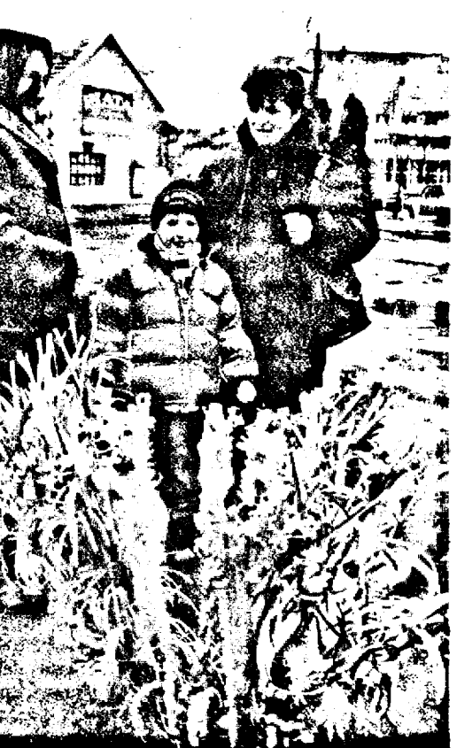
Unii copilași nu pot să creadă că Moșul le va pune în ghetuțe bețe „ninsă”

plăcut. Cred eu că atâta timp cât avem două mâini și putem să muncim, nu trebuie să ne plângem. Nu este ușor, suntem o familie de ingineri, muncim foarte mult, nu este întotdeauna ușor să faci față tuturor nevoilor, însă nimic nu este imposibil, atunci când vrei cu adevărat!”