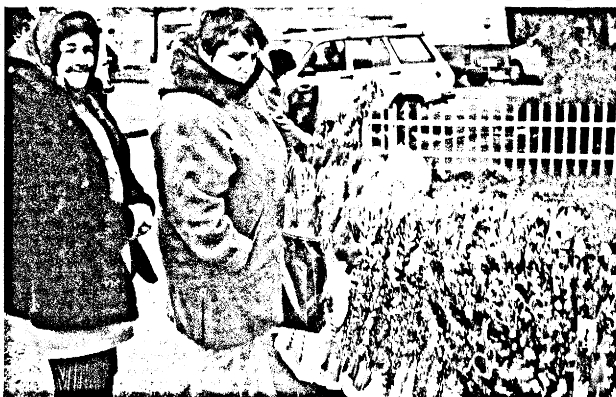
Lumea stă, cugetă, compară și abia mai apoi târguiește

Vin sărbătorile. Însotite, la „mustată”, de febra cumpărăturilor. Pietele sunt pline, supermarketurile sunt pline, alimentarele sunt și ele tic-site... Lumea cumpără de parcă ar fi ultimul lucru din lume pe care-l face, înainte de vreo calamitate... Și cumpără orice. Cumpără lucruri de care nici n-a crezut că are nevoie. Fiindcă trece pe lângă ele, le vede... și... de ce nu?! Dar numai DUPĂ ce-a dat o groază de bani pe cele strict necesare. Și, din nou, numai DUPĂ ce-a trecut în revistă toate prețurile posibile, în așa fel încât să le aleagă pe cele mai mici. În mod ciudat, senzația, în piață, este aceea a unei lumi care nu prea are bani. Unii se târguiesc mult, mult de tot înainte de a achiziționa ceva. Românul s-a schimbat. A început să simtă valoarea banului. Acel român de după Revoluție, care nu se târguia deloc, fiindcă „era rușine” (de unde, oare, această mândrie deșartă?!), a dispărut, în timp, încât astăzi nu mai există. Nu mai e rușine să negociezi. Ba, dimpotrivă.