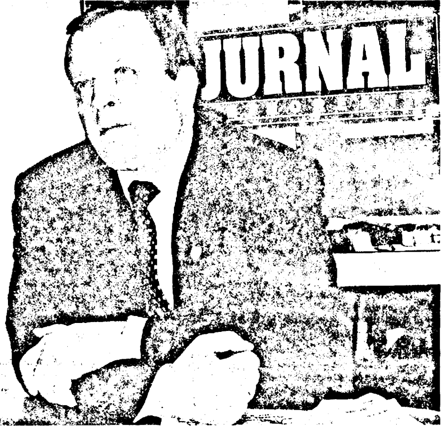
Ministrul Gh. Flutur a răspuns tirului nostru de întrebări.

Cariera politică: senator de Suceava; 2000 - 2004 - membru în comisia de Agricultură, Silvicultură și Industrie Alimentară; vicepreședinte PNL