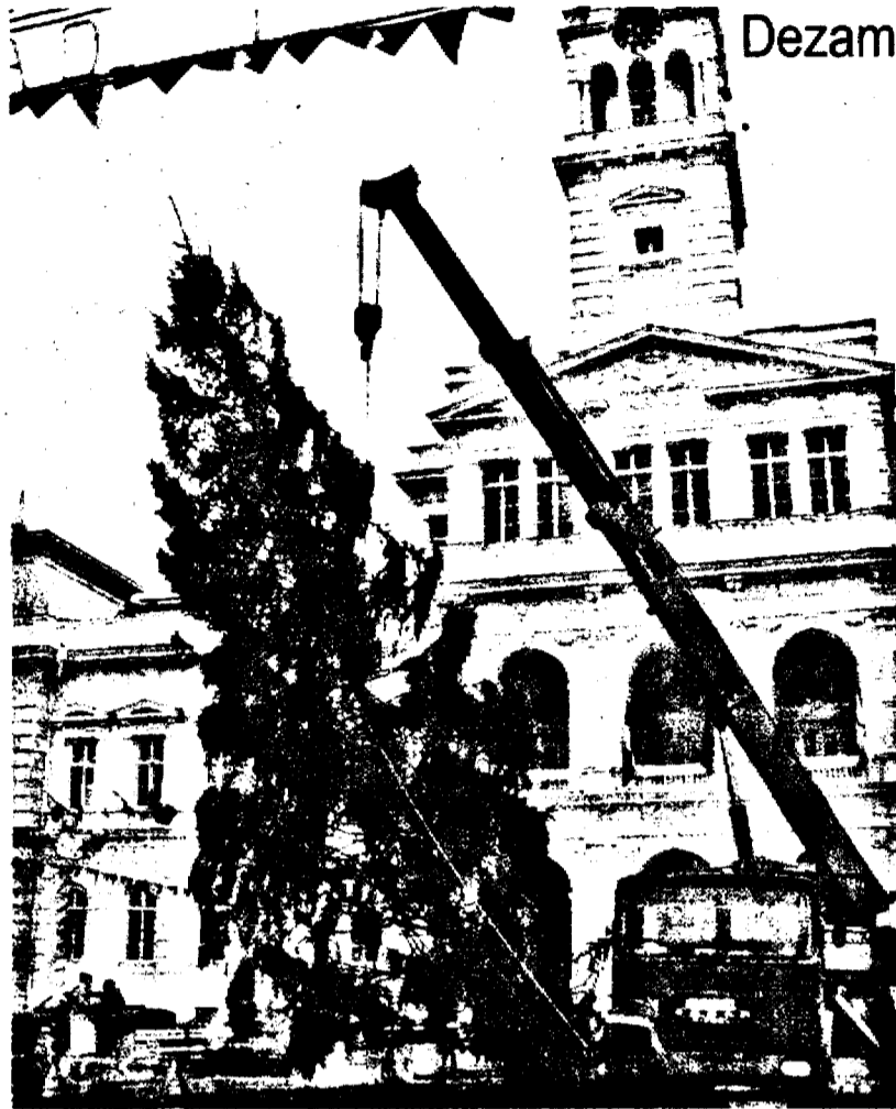
Hotărât lucru, arădenii merită un brad de Crăciun mai... proaspăt

Dezamăgit de aspectul pomului de la Zimbru