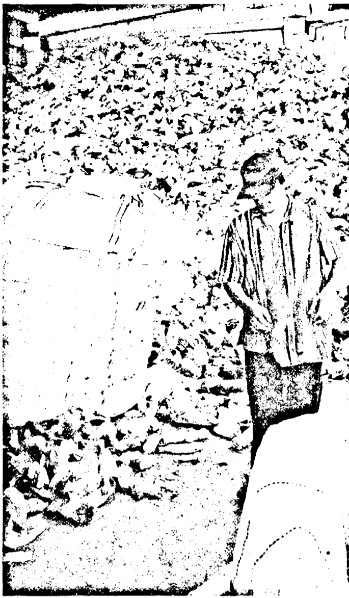
Zeci de societăți arădene colectează PET-uri