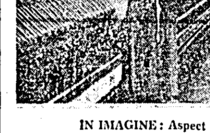
IN IMAGINE: Aspect din secția filatură a Uzinei „30 Decembrie”.

Biroul comitetului județean de partid apreciază că în acest spirit toate organele și organizațiile de partid, de masă și obștești, unitățile economice, social-culturale și de analiză temeinică a muncii, să trecem la îmbunătățirea radicală a stilului și metodei noastre de muncă. În actuala etapă de dezvoltare multilaterală a țării, partidul cere din partea tuturor oamenilor muncii mobilizarea pleneră a tuturor forțelor și energiiilor creatoare. Trebuie să promovăm un spirit viu, dinamic, să combatem cu toată hotărîrea fenomenele negative de orice natură ar fi ele.