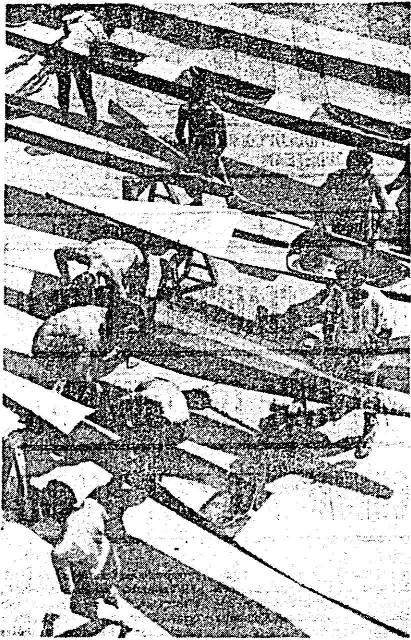
Asociația sportivă „Voința”. Se pregătesc caietele-canoe pentru noi întreceri.

După modelul brigăzilor voluntare de ordine și control ale tineretului din municipiul Arad, s-au înființat în săptămîna trecută brigăzi similare și în orașele Ineu, Lipoava, Sebiș și Pincota. Brigăzile vor efectua raiduri-anchetă prin care se urmărește modul de comportare a tineretului prin cofetării, restaurante și pe stradă.