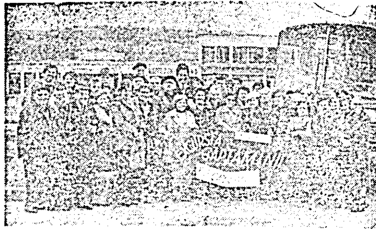
O nouă inițiativă a O.J.T. Arad: acțiunea denumită „Excursia săptămînii”, cu durată de 1—2 zile, cu grupuri constituite la cerere. Prima asemenea excursie a avut loc pe ruta Arad — Brad — Deva — Arad (în fotografie: o amintire de la băile Vața de Jos). Următoarea excursie a săptămînii va avea loc la 1 aprilie, la băile Felix.