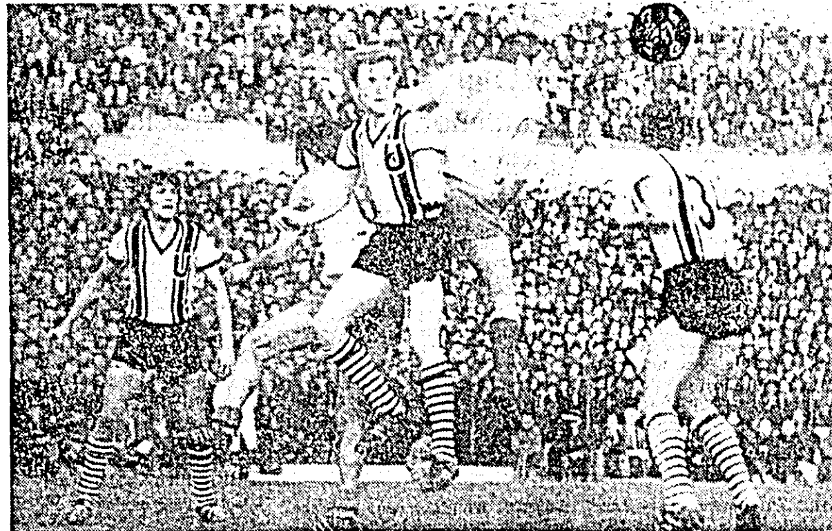
Fază din meciul U.T.A. - Universitatea Cluj.