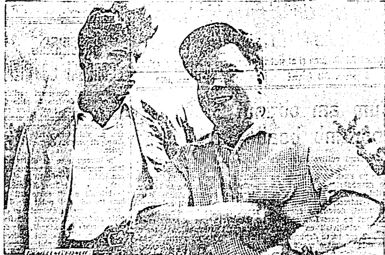
IN CLIȘEU: o imagine din filmul „Un meci neobișnuit”