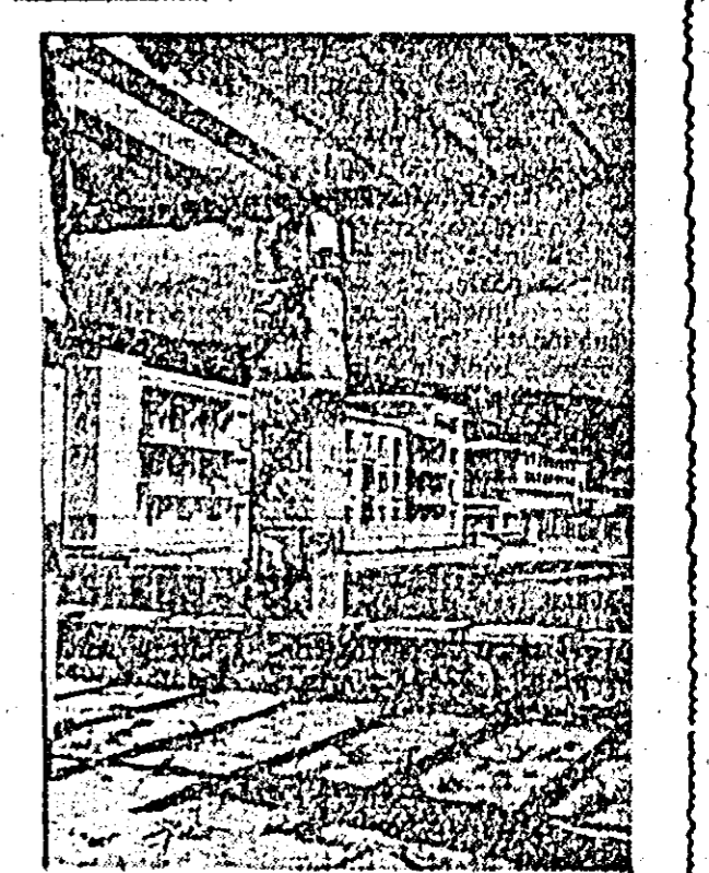
Podul peste Iantzi de la Cluj-Zin, China de sud-vest, a fost dat în folosință la 10 decembrie 1959...