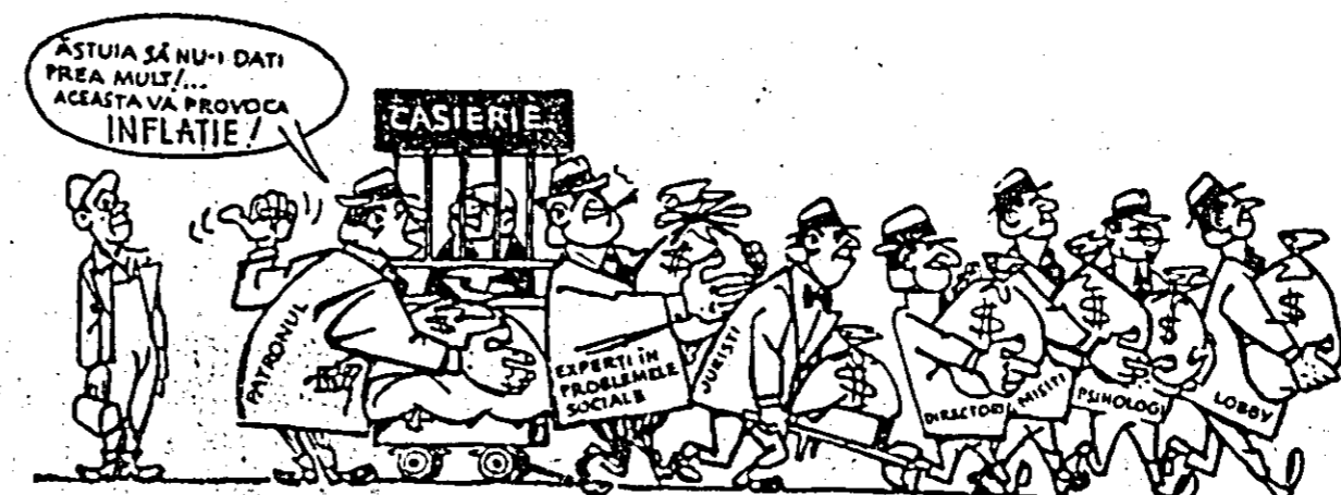
Desen de F. WRIGHT din revista sindicală americană „U. E. NEWS”

DJAKARTA 10 (Agerpres). În Indonezia continuă mișcarea de protest împotriva intenției Olandei de a-și spori forțele armate din Irianul de Vest.