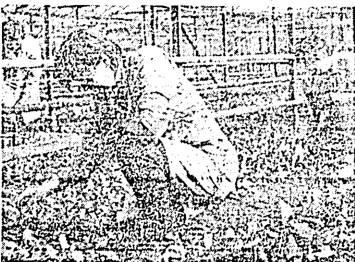
Lucrări de întreținere a culturilor în ferma Dorobanți a A.E.C.S. Sere Arad.