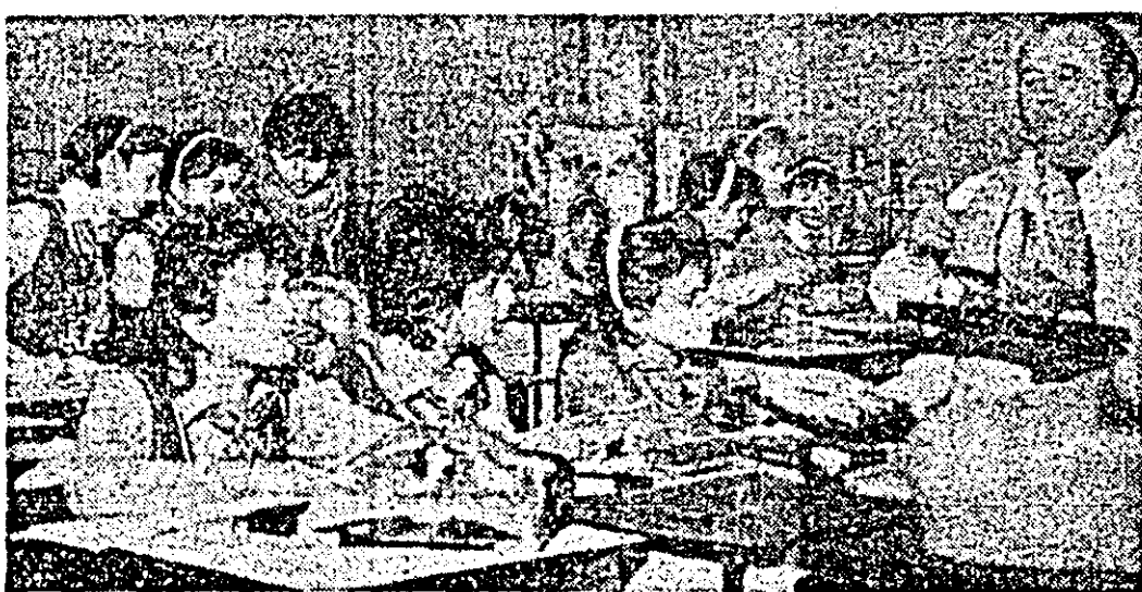
Cercul „Prieteni adevărați științific” de la Liceul „I. Slavici”.

Există doritori care vor să citească, să știe și mai multe despre vise? Există desigur și o mulțime de e-levi ridică mîna. Profesorul le propune sîmedenie de cărți, atunci scoase de la biblioteca școlii, oferindu-le curiozității nepotolite și ler-tile a tinerelor vîrstare. A-poi anunță tema viitoarei întîlniri pe tema „Ce știm despre viață și moarte? Întrebări și răspunsuri”. În-teresul manifestat era a-prosopie exploziv, prevestind o viitoare dezbateră optin-să și pasionantă în care convingeri materialist-științifice despre lume și viață se adună una după alta plămînd personalități umane debarasate de prejudecăli.