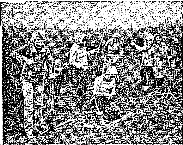
Pregătirea puleților pentru plantat în ferma pomico-lă din Dorobanți.