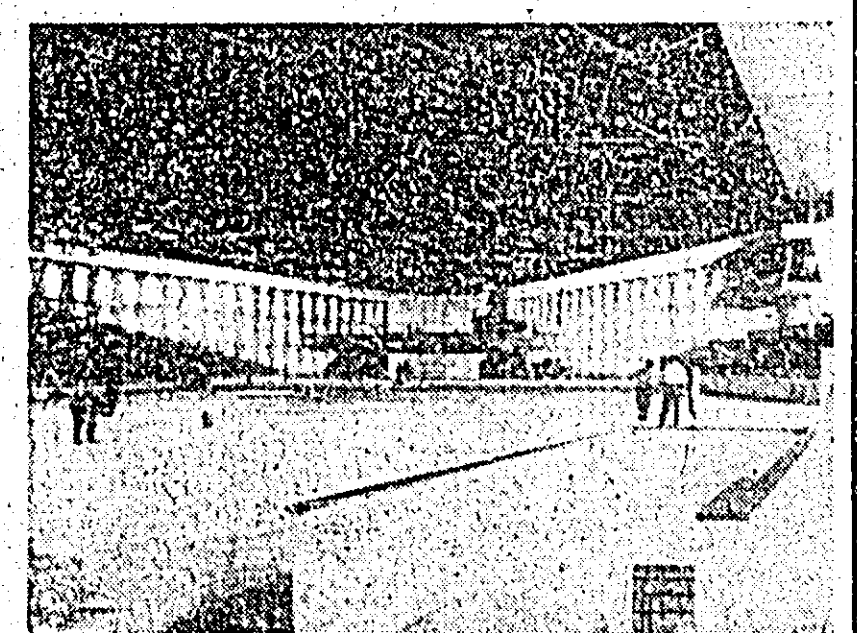
Vedere de interior a noului sălii sportive „Festival 68”, construită recent la Sofia.

tea avea o legătură cu apariția obiectelor zburătoare neidentificate. „El a arătat că există o „stranie coincidență”: în timp ce asemenea obiecte erau văzute deasupra statului New York, un puternic șoc electric trecea prin substația de la frontiera canadiană din apropierea cascadei Niagara, acționând asupra instalațiilor de siguranță și intrerupind curentul electric la New York.