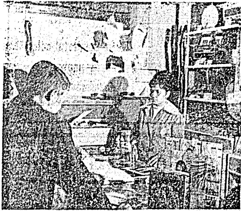
IN IMAGINE: magazinul „Romanta” din Arad, locul pe unde melomanii trec adeseori.