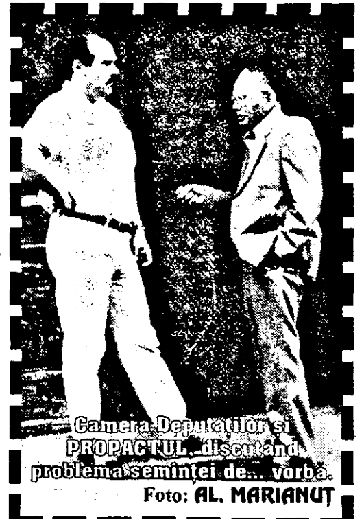
Camera Deputaților și PROPACTUL discutând problema sesiunii de... vorbă.

Ne menținem punctul de vedere că decizia finală în problema aderării la NATO trebuie să aparțină popoului român, chemat să se pronunțe prin referendum asupra ei.