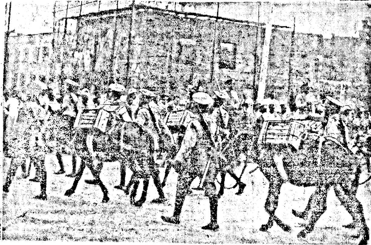
Az abesszin császár testőrsége Dessle felé vonul, hogy elhárítsa Addis Abeba felől az olasz légitámadásokat

A Daily Mail haditudósítója jelenti Addis Abebából, hogy Vehib pasa volt török tábor- nok, az ogadeni abesszin haderők főparancs- noka lett. Vehib tábornok a harrari kormány-