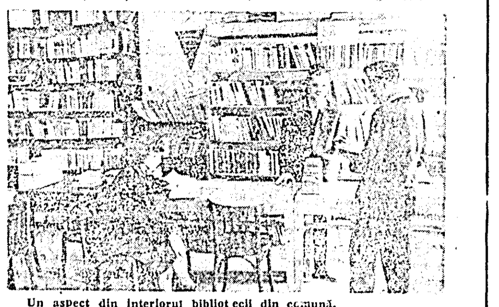
Un aspect din interiorul bibliotecii din comuna.

de acțiunii de popularizare a cărții. Așa de pildă, au avut loc proiectii de diaprame care înfățișau diferite povești; s-au organizat ore de basme sau prezentări de cărți și altele la care au participat cititorii bibliotecii precum și alți cetățeni, ceea ce dovedește interesul pe care-l manifestă populația din mediul rural față de literatură în general.