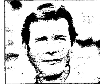
LUNI PRO 7 - 21,15 Camera de închiriat - comedie polițistă SUA

9,30 Aerobic 10,00 Autoraliul RAC - Anglia 10,30 Inot sincron 11,30 Patinaj artistic - Cupa Laliq - Paris 13,00 Schi alpin CM Elveția 14,00 Honda - motosport magazin 15,00 Autoraliul 15,30 Tennis feminin - Virginia Shims Masters - New York 17,30 Fotbal american 18,00 Euro fun magazin 18,30 Patinaj artistic 20,30 Știri 21,00 Nascar - automobilism 22,30 Autoraliu 23,00 Box 0,00 Eurogoluri 1,00 Golf Japonia 2,00 Știri