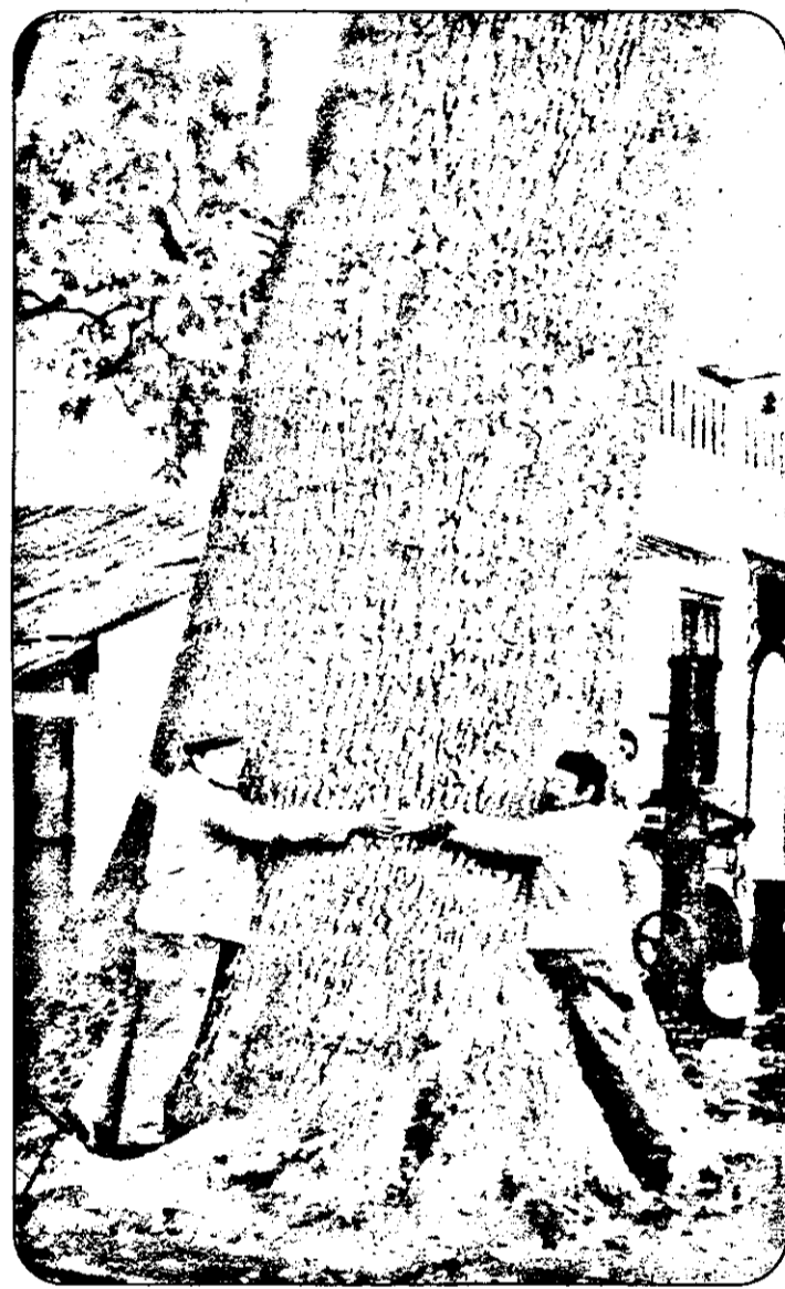
Stejarul din imagine are aproape șase veacuri! Câte visuri nu s-au țesut la umbra lui...