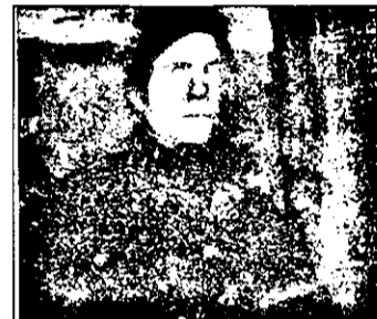
DUMINICĂ PRO 7 23,20 Duminică neagră - film acțiune SUA

9,00 Știri ITN 9,30 Emisiune de religie 10,00 Chica lui David - emisiune