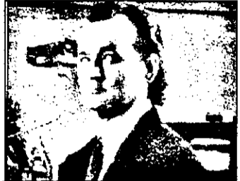
DUMINICĂ PRO 7 21,15 Sărbători de Crăciun - comedie SUA

19,30 Versuri 19,40 Desene animate 20,00 Familia SRL - serial distractiv maghiar 20,35 Emisiune de varietăți 23,05 Documentar american despre