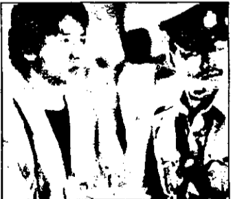
LUNI PRO 7 - 23,10 Prima misiune - film de acțiune

13,32 Teletext 17,00 Știri 17,10 Emisiunea pentru școlari 17,25 Putere și pasiune - serial australian, ep. 129-130 18,15 Tradiții 18,55 Simboluri 19,05 Joc telefonic 19,27 Muzică 19,35 Roata norocului 20,07 Desene animate 20,17 Religie pentru copii 20,30 Telegazeta 21,05 Colombo - serial american: „Crimă la telefon” 22,20 Documentar 23,00 Forum politic 23,55 Jurnal teatral 0,35 Știri 0,40 Jurnal BBC