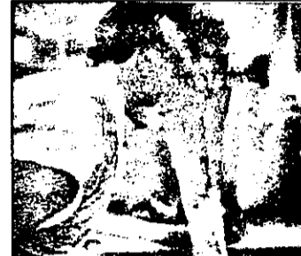
VINERI PRO 7 - 0,15 Materia - film sf SUA, 1988

7,00 Magazin matinal 10,10 Vecinii - reluare 10,35 Trapper John - reluare 11,25 Bonanza - reluare 12,15 Tele-concursuri 13,25 Tânăra și fără odihnă - serial american