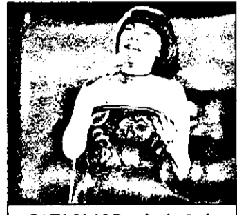
SAT1 21,15 Parada șlagărelor

11,25 Bonanza - reluare 12,15 Teleconcursuri 13,25 Tânăr și fără odihnă - serial american „Urmă trecătoare” 14,15 Trapper John M.D. - serial american „Supravegherea spitalului” 15,10 Vecinii - serial american 15,40 Bonanza - serial western american 16,40 Star Trek - serial american