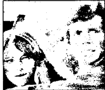
PRO7 0,30 Duel in Vaccares - film acțiune Anglia-Franța, 1974

TVR 2 13,00 În direct: Canal France International 14,00 Actualități 14,10 Compozitori americani 15,05 Jazz magazin 16,00 Telegoc în limba spaniolă 16,30 Perrine - desene animate 17,00 Texc - Belgia, episodul 5 18,00 Magazin economic 20,00 Video-satelit 21,00 TV Mesager 21,30 Limba franceză - reluare 22,00 TV 5 Europe - Telegoc în limba franceză 22,30 Credo