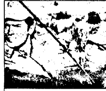
SAT1 23,30 Parașutiștii - film război SUA, 1966

23,15 Curs de engleză - reluare BUDAPESCTA 1 7,05 Viața satului 7,25 Jurnal regional 7,35 Știri economice 7,45 Știri 8,00-10,00 Magazin matinal 10,00-13,00 Magazin