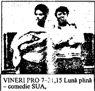
VINERI PRO 7-21,15 Lună plină - comedie SUA.

16,10 Teletext, prezentare program, meteo 16,20 Oameni și mori de vânt în Portugalia - documentar german 17,05 Desene animate 17,30 Victoria accidentului - docu-