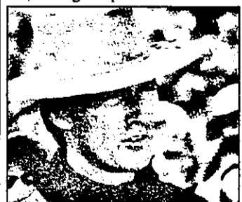
SÂMBĂTA PRO 7 - 21,15 Spânzurați-! - western SUA

7,00 Magazin matinal 8,40 Curs de franceză 9,00 Știri 9,05 Jurnal canadian 9,35 Bibi și prietenii - serial pentru copii 10,30 Magazin economic 12,10 Panoramic european 12,40 Politică internă belgiană 13,05 Magazinul alpinistilor 13,40 Jurnal elvețian 14,05 Magazin economic 14,20 Întreprinderi franceze 14,50 Țările sudului 15,50 Magazin de literatură 16,45 Correspondență 17,10 Curs de lb. franceză 17,35 Concurs tv 18,00 Magazin pentru tineri