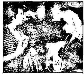
PRO 7 14,00 Rhinestone - comedie SUA, 1984 cu Sylvester Stalone

12,15 Magazin medical 12,40 Roata norocului 13,25 Tânăr și fără odihnă - serial american 14,10 Trapper John MD - serial american 15,10 Vecinii - serial australian 15,40 Bonanza - serial western 16,40 Star Trek - serial sf american 17,45 Concursuri tv 19,00 Jurnal regional