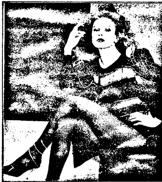
„La urma urmei, toți bărbații urmăresc același lucru”.

- Trupul și... dragostea noastră, că doar n-or fi ei de... neînduplecat.