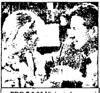
PRO 7 2,25 Viziuni ale groazei - film groază SUA, 1991

7,05 Viata satului 7,25 Jurnal regional 7,35 Știri economice 7,45 Știri 8,00-10,00 Magazin matinal 10,00-13,00 Magazin 10,30 Riviera - serial 11,30 Lumea misterioasă a Oceanului Atlantic - documentar 12,30 Telegazetă 13,00 Știri 13,07 Financial Times magazin 13,32 Teletext 16,30 Vitrina - magazin informativ 17,00 Știri 17,25 Telesport - fotbal - rezumat 18,00 Miami Vice - serial polițist american 19,00 Emisiune pentru adolescenți 19,25 Joc pe teme de literatură 19,50 Desene animate 20,30 Telegazetă 21,05 Telesport 21,10 Vecinii - teleroman maghiar 21,40 Friderikusz show 0,05 : „24 de ore”