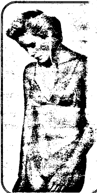
Sunt tinere, sunt frumoase și iubesc. Numai că la ele iubirea a devenit o „profesie”.

- Eu nu sunt pentru o îmbogățire imediată, am foarte multă răbdare. Atâta timp cât iau doar doi clienți zilnic pe lângă afaceri pot să pun și eu puțin suflet. Astfel se simte și el mai bine, iar eu sunt mulțumită că mi-am făcut „serviciul” conștiințioasă.