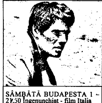
SÂMBĂTA BUDAPESTA 1 - 21,50 Ingenunchiat - film Italia

5,20 Tata-i cel mai bun - serial american 5,45 Lassie - serial american 6,10 Flipper - serial american 6,35 Elefanții și Himalaia - documentar 7,25 Reluări seriale 9,25 Îi spuneau Gringo - western SUA - reluare 11,05 Cutia schimbată - comedie polițistă Anglia 13,05 Care de ași - reluare 13,35 Liniștită noastră casuță - reluare 14,05 Staruri și animale - reluare 14,15 Kung Fu - serial acțiune american: Caine și jucătorul 15,15 Aventură în Malaezia - serial aventuri american: „Samuraiul” 16,15 Solomon și regina din Saaba - film istoric SUA, cu Yul Brinner, Gina Lollobrigida 18,30 Joc dur - serial american: A