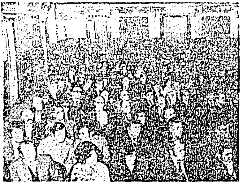
Aspect de la consfătuirea județeană a echipelor de control obștesc.

PARTICIPANȚII LA CONSĂTUIREA JUDEȚEANĂ A ECHIPELOR DE CONTROL OBȘTESC, ARAD