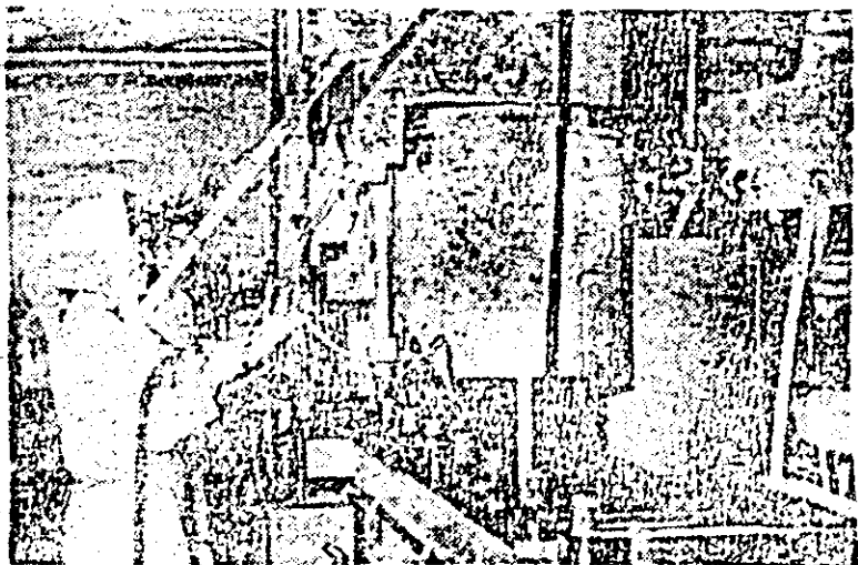
Aspect din secția răcoritoare a fabricii „Progresul”.