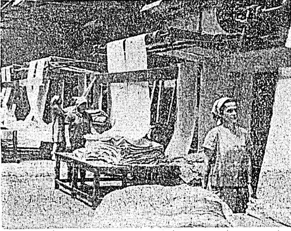
Secția de seamășat a uzinelor textile „30 Decembrie”. Aici se prelucurează zilnic mii de metri de țesături.