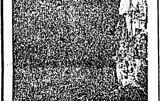
ÎN CLISEU: Munții Apuseni — intrare în peștera Cetățile Ponorului.