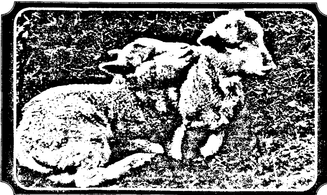
Și totuși, primăvara e pe-aproape!