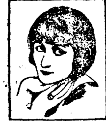
Mlle. NAPIERKOWSKA de l'Opéra Comique