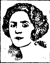
Mlle. VERA SERGINE du Théâtre Antoine