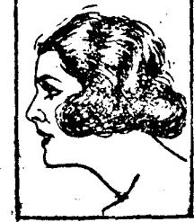
Mlle. ELVIRE POPESCO du Théâtre du Gymnase