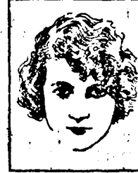
Mlle. HUGUETTE DUFLOS de la Comédie Française