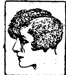
Mlle. GABY MORLAY du Théâtre Antoine