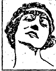
Mlle. CARLOTTA ZAMBELLI de l'Opéra