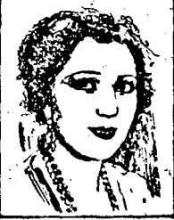
Mlle. RAQUEL MELLER du Palace