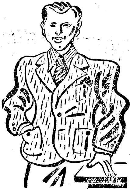
DEGRELLE a rexista vezér

A belga szocialistapárt nagygyűlésén Van der veldt volt miniszterelnök bejelentette, hogy szükségesnek tartja a semlegességi egyezmény átrovidítelését, mert az a felhívása, hogy nem lehet megakadályozni, hogy a külállamok a spanyol kormánynak élelmiszert szállítsanak.