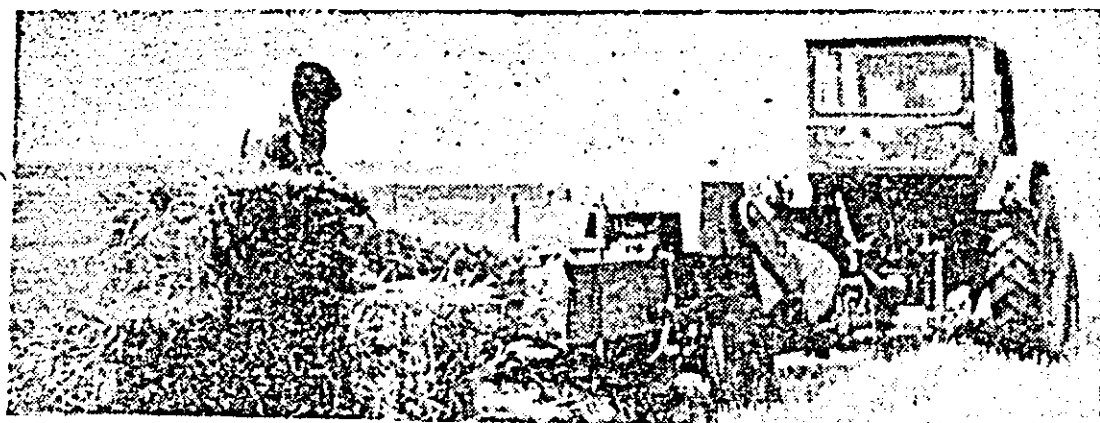
În flux continuu, după recoltat, presele balotează paiele eliberând terenul pentru culturile duble.