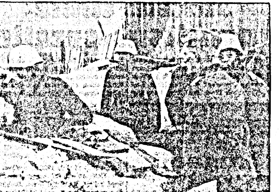
Tranșee de avantpost germană, în preajma Leningradului

că în ziua de 5 Ianuarie se va ține la Rio de Janeiro conferința panamericană.