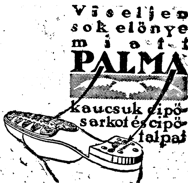
Radio Hirdetési Iroda 2887/a. sz.

— Bécsi nemzetközi tavaszú vásár. A Kereskedelmi és Iparkamara közli: Az 1923. március 18—24. napjain tartandó bécsi nemzetközi tavaszú