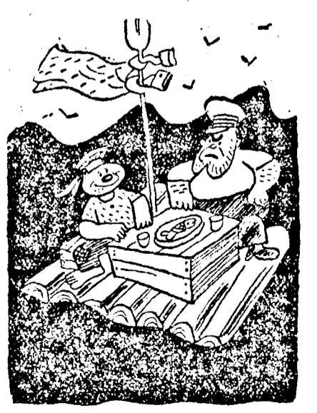
Ezt nem is álmodtam volna, hogy én valaha a kapitány urral egy asztalnál ülök.