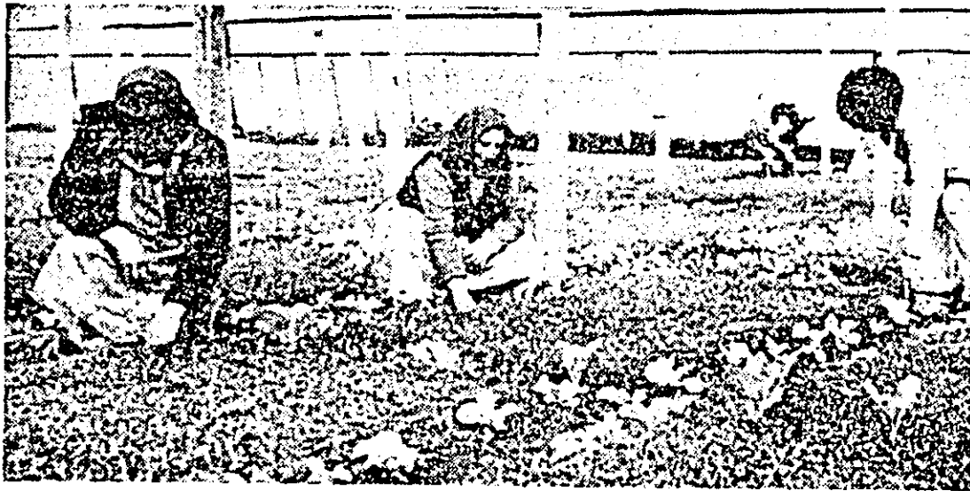
Asociația legumicolă Horfa va aproviziona, în acest an, municipiul Arad cu însemnate cantități de legume. În fotografie: pregătirea răsădirilor pentru viitoarea recoltă.

de familii beneficiind, în plus față de anul precedent, de posibilități de a-și produce necesarul de legume și zarzavaturi; • sprijinirea gospodăriilor anexe ale consumurilor colective cu terenuri destinate cultivării cu furaje și legume; • organizarea participării efective a locuitorilor municipiului la realizarea, în bune condiții, a lucrărilor agricole din zona prearădănească — garanția asigurării unei aprovizionări corespunzătoare cu produse agroalimentare.