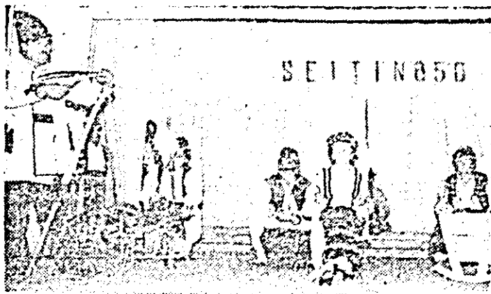
Moment din montajul literar-muzical-coregrafic dedicat aniversării a 850 de ani de atestare documentară a Șeitinului.