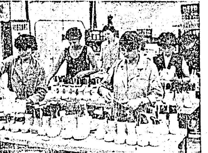
Aspect de muncă în atelierul cizmărite al întreprinderii „Ardeanca”.

no-iugoslave în folosul popoarelor noastre, al progresului și prosperității celor două țări, al cauzei generale a păcii și înțelegerii în Balcani, în Europa și în întreaga lume. În cadrul schimbului de vederi cu privire la situația internațională actuală s-a subliniat necesitatea de a se acționa cu fermitate pentru oprirea cursului periculos al evenimentelor spre confruntare și război, pentru încetarea cursului înarmărilor și trecerea la dezarmare, în primul rînd la dezarmarea nucleară. În acest context, oaspețele a apreciat inițiativa României de a trece la reducerea cu 5 la sută, pînă la sfîrșitul acestui an, a armamentelor, efectivelor și cheltuielilor militare. În cursul convorbirilor a fost subliniată necesitatea de a se face totul pentru soluționarea tuturor conflictelor și problemelor litigioase dintre state pe cale politică, prin tratative, pentru reluarea și consolidarea politicilor de destindere, înțelegere, colaborare și pace pe continentul nostru și în întreaga lume.