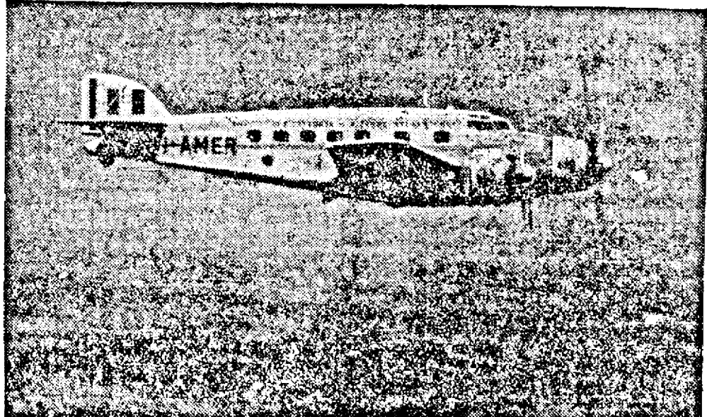
Italia inaugurează în luna Noembrie 1939 un serviciu poștal aerian cu stațiile Americii de Sud. În clișeu, avionul care va deservi acest serviciu.