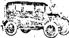
Sedan, 5 ülésel, 2 ajtóval