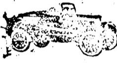
Torpedo, 2 ülésel