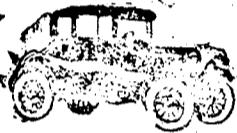
Coupé, 2 ülésel

A modern Ford mellett most is változatlanul megfelel annak a célnak, amit annak idején Henry Ford a kocsit megkonstruálásánál magának kitűzött: kényelmes és erőteljes, úgyhogy egy egész család is bátran használhatja, kezelése, vezetése végtelen egyszerű, üzemköltsége a lehető legkisebb. Amellett minden alkatrésze olyan elsőrendű anyagból készült s olyan tartós, hogy nincs a világnak második autógyára, amely hasonló minőségű gépet csak megközelítő áron is adni tudna.