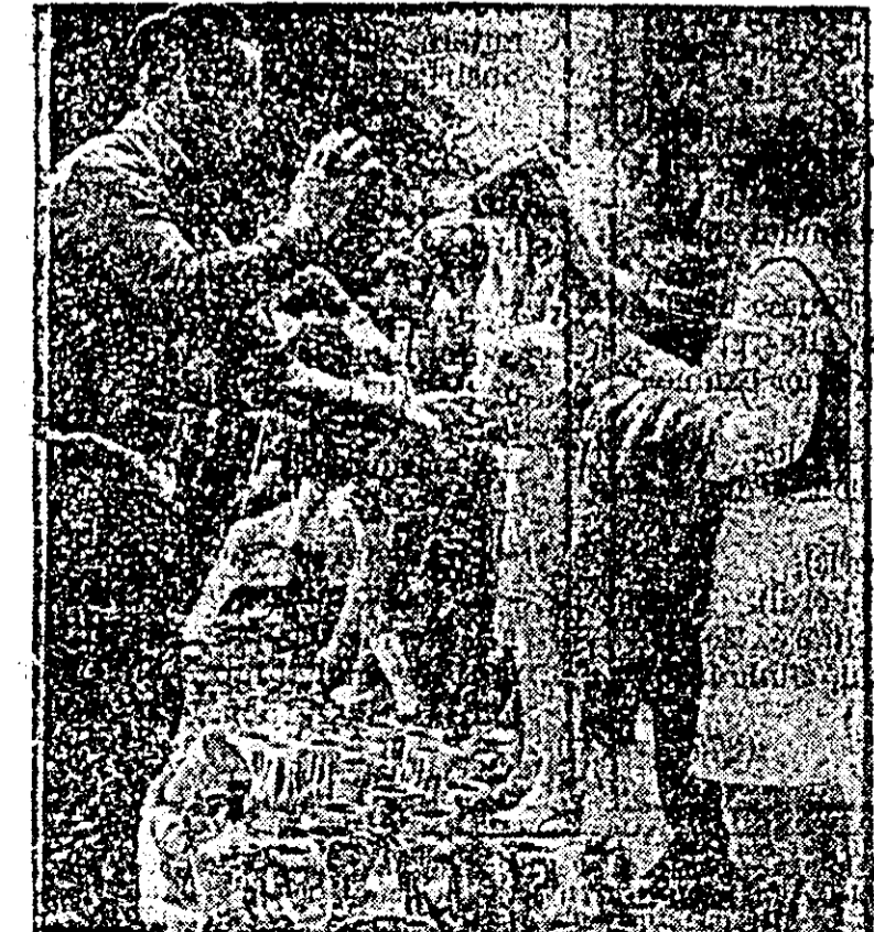
Tirgul meșterilor olari s-a bucurat de mult succes.