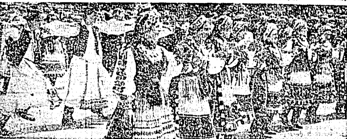
Doi momente semnificative de la parada portului popular.