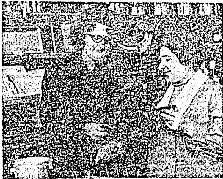
Aspect din magazinul „Mena”.

Ultimul termen pentru verificarea tehnică anuală (pe 1976) a autoturismelor expiră la 1 lună a.c. Membrii clubului pot să execute verificarea respectivă la atelierul din str. Unirii nr. 8, zilnic între orele 7-20.