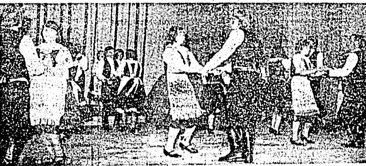
Instantaneu de la spectacolul de închidere a festivalului.