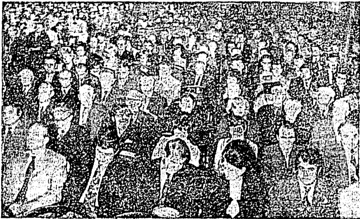
Aspect din timpul desfășurării lucrărilor plenare.

Analizând munca politico-ideologică și cultural-educativă desfășurată de organele și organizațiile de partid prin prisma exigențelor actuale, a rezultatelor în activitatea de înlăptuire a sarcinilor economice și sociale, se desprinde însă concluzia că munca de propagandă mai are neîmpliniri, care influențează nefavorabil rezultatele ce se obțin. Repercusiuni negative, care se răfring nemijlocit asupra bunului mers al activității în unitățile productive, au unele fenomene de indisciplină, cum ar fi întârzierile, absențele nemotivate