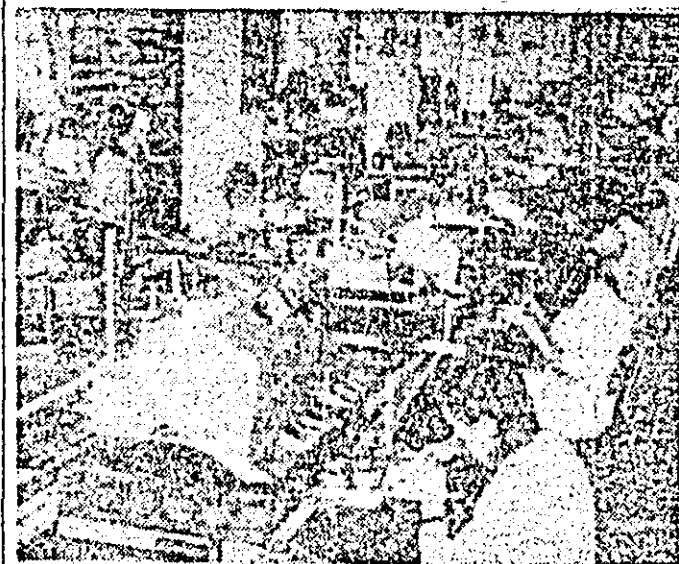
Instantaneu în secția montaj a întreprinderii „Victoria”.