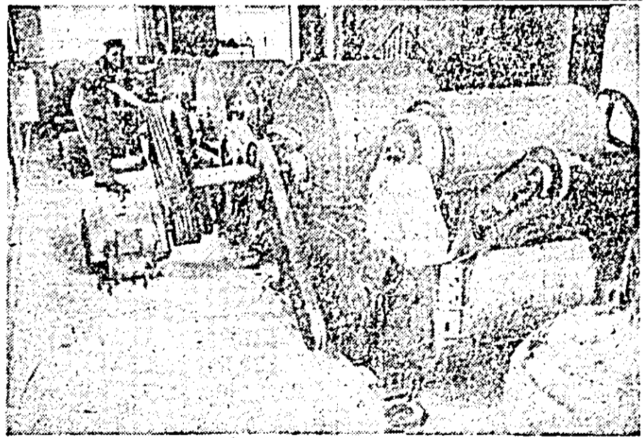
Ceaa ce vedeți în clișeu este o mașină de la fabrica „Teba”, pentru destrămătură deșeurilor. Cu ajutorul acesteia se obține o productivitate mare și se reduce prețul de cost prin folosirea deșeurilor în cantități masive.