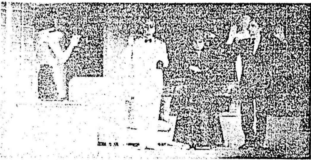
Moment din spectacolul în premieră al Teatrului de stat cu piesa „Joc dublu” de Robert Thomas.