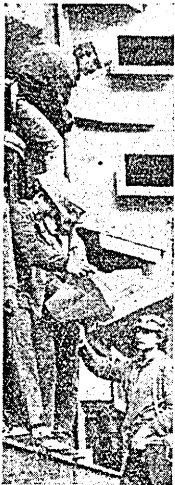
Constructori pe șantier.