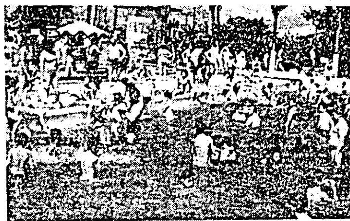
Alinașă de vizitatori la băile termale „Prietenia”.

cord global, fiind zilnic prezente la toate lucrările. Cu eforturile conjugate ale tuturor s-a reușit nu numai obținerea unei producții mari de varză timpurie, ci și „prinderea” perioadei de valorificare cu cel mai bun preț la export, la care se adaugă și primele de export. Startul deci, a fost bun, cultura de varză și tomate promișind în continuare un rod bogat; există astfel toate premisele pentru obținerea veniturilor la care s-au angajat legumicultorii din Zimandă Nou.