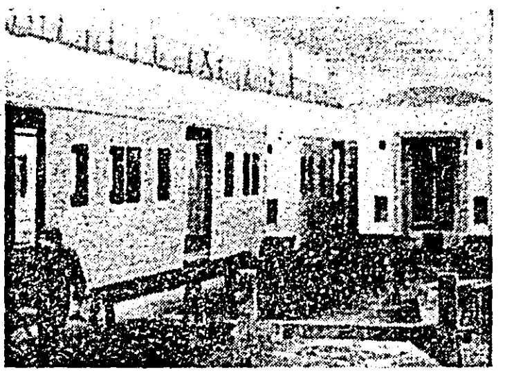
Aspect general din secția de montaj vagoane de clasă I.V.A.

● Trebuie impulsionate prașilele, astfel ca peste tot să se realizeze viteza zilnică planificată ● Concomitent, să se finalizeze toate lucrările de pregătire pentru a se asigura buna desfășurare a campaniei de recoltare ● Toate furajele să fie cit mai repede strînse și însilozate!