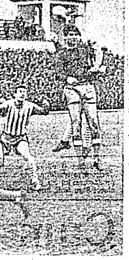
Duel aerian în meciul de fotbal UTA—Progresul.