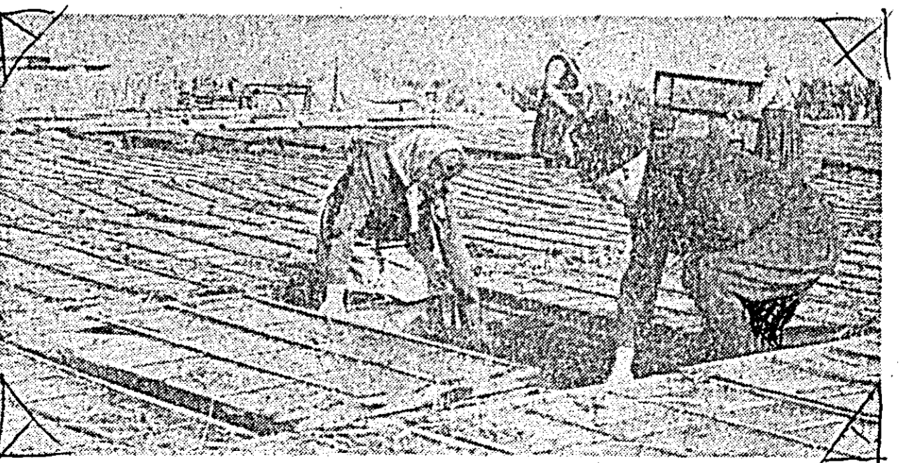
La cooperativa agricolă de producție din Sintana răsădnicile pentru culturile forțate și pentru cele din cîmp se întînd pe o suprafață de 4.200 m. p. ÎN CLÎȘEU — un aspect înfîșîșind o parte din răsădnicile.

Printre acestea se numără și sfeccla de zahăr, ce se cultiva pe 150 ha. În fiecare an, aplicîndu-se o agrotehnică superioară, se obțin producții și venituri mari la hectar — anul trecut, bunăoară, cu toată seceta, s-au recoltat 25.000 kg sfecclă la ha. În vederea sporirii producției și în acest an, s-au