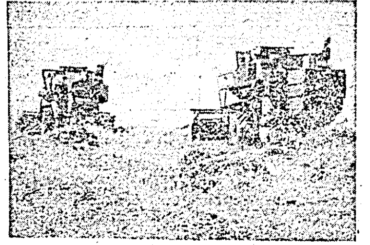
Secerișul orzului la C.A.P. Șagu.