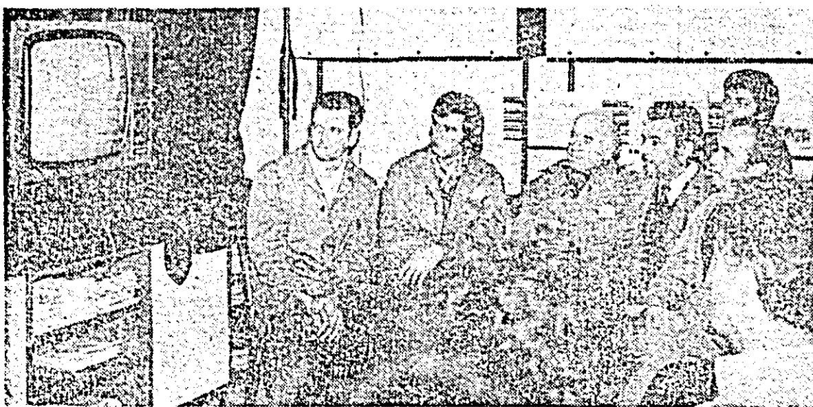
Raportul prezentat de tovarășul Nicolae Ceaușescu este urmărit cu viu interes și la I.S.A.

„Ne exprimăm sentimentele de profundă dragoste și respect pentru contribuția inestimabilă a dumneavoastră, mult iubite tovarășe secretar general, la fundamentarea istoricelor documente ale Congresului al XII-lea, convingerea neștirmitată că politica profund științifică și umanistă a partidului nostru corespunde în cel mai înalt grad intereselor și aspirațiilor fundamentale ale poporului român — se spune printre altele în telegrama Liceului agroindustrial din Minis. Ne angajăm să acționăm cu abnegație și dîruire pentru îndeplinirea sarcinilor ce ne revin, pentru a da viață hotărîrilor ce vor fi adoptate de cel de-al XII-lea Congres al partidului”.