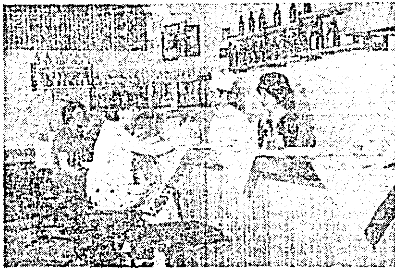
La complexul hotelier „Ardealul” s-a deschis recent un bar pentru micul dejun și alte preparate pregătite la cererea clientului — o formă modernă și promptă în satisfacerea cerințelor consumatorilor.